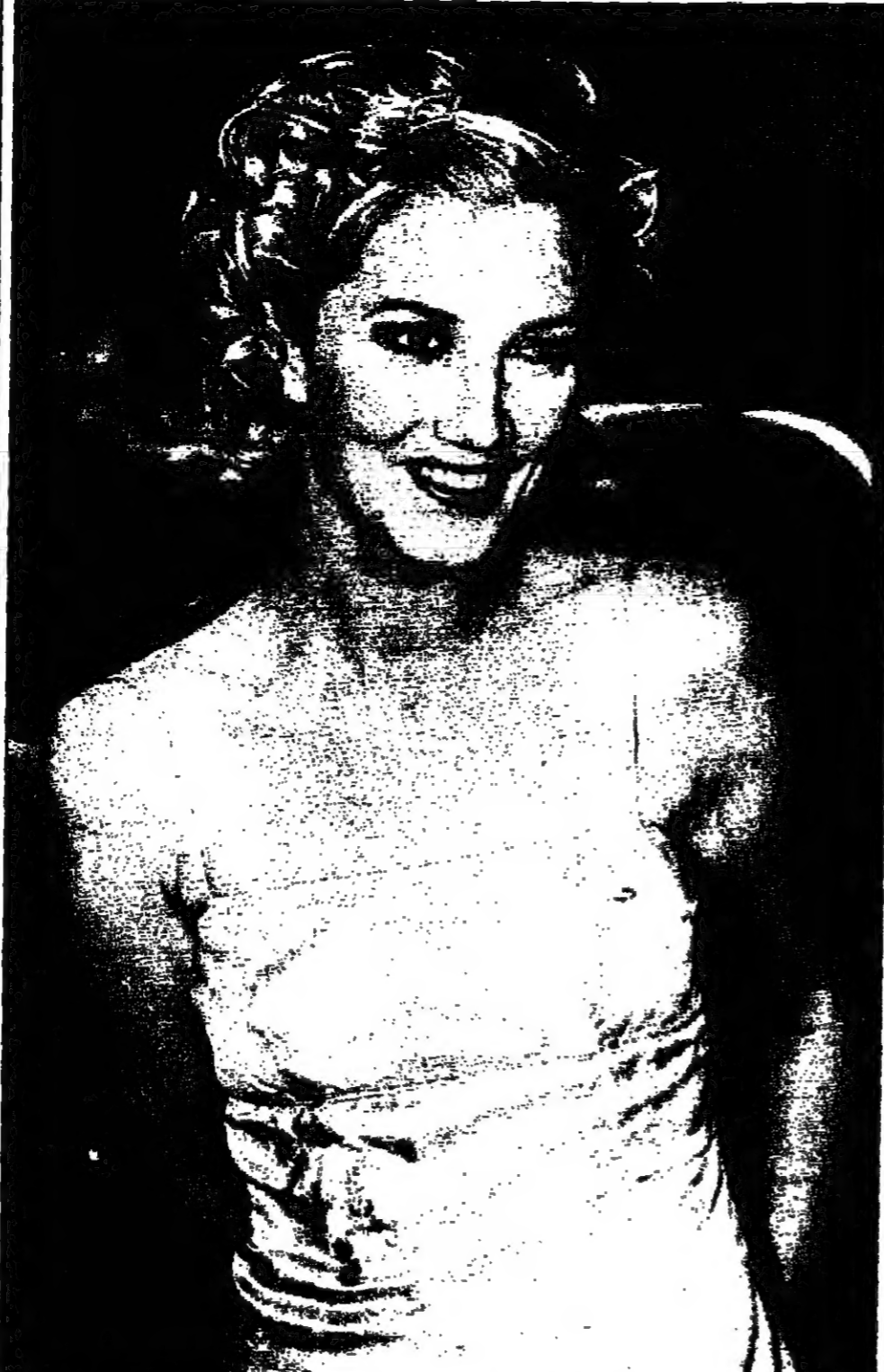
التمجة جولي ويتشارنسون حضرت حفل العرض الاول لفيلمها الجديد 'محدثات الألف' في بيفرلي هيلز (لوس انجلس) ليلة امس الأول وهو من افلام الخيال العلمي ويتناول رحلة لانقاذ سفينة قضاة في العام 2047